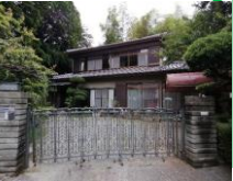
ひのきの廊下と坪庭